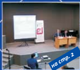
на стр. 2

НА ЕВРОПЕЙСКИЯ ИНФОРМАЦИОНЕН ЦЕНТЪР ЕВРОПА ДИРЕКТНО – СТАРА ЗАГОРА