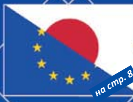
на стр. 8