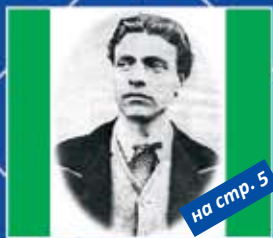
на стр. 5