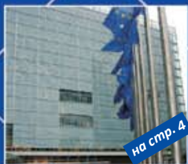
на стр. 4