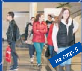
на стр. 5