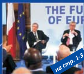
на стр. 1-3