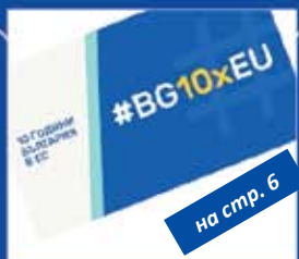
на стр. 6