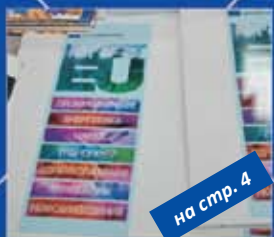
на стр. 4