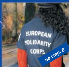
на стр. 8