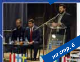
на стр. 6