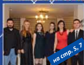
на стр. 5, 7