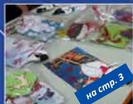
на стр. 3