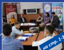
на стр. 1-3