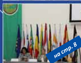
на стр. 8