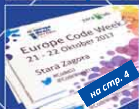
на стр. 4